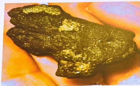
طلا در سنگ آتشفشانی